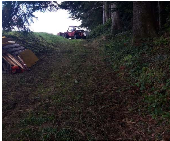
Schienen schleifen und montieren