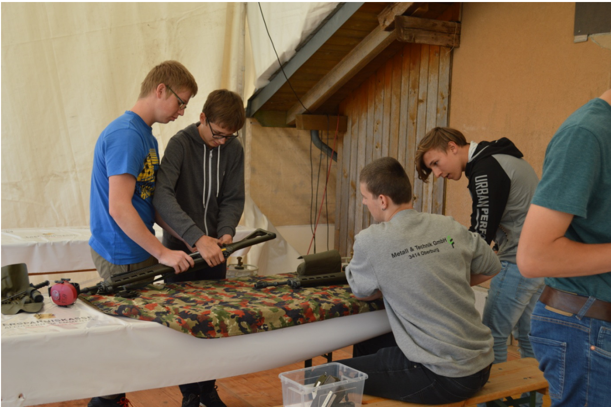
Ein gut gefülltes Schützenhaus mit jungen und motivierten Schützinnen und Schützen.