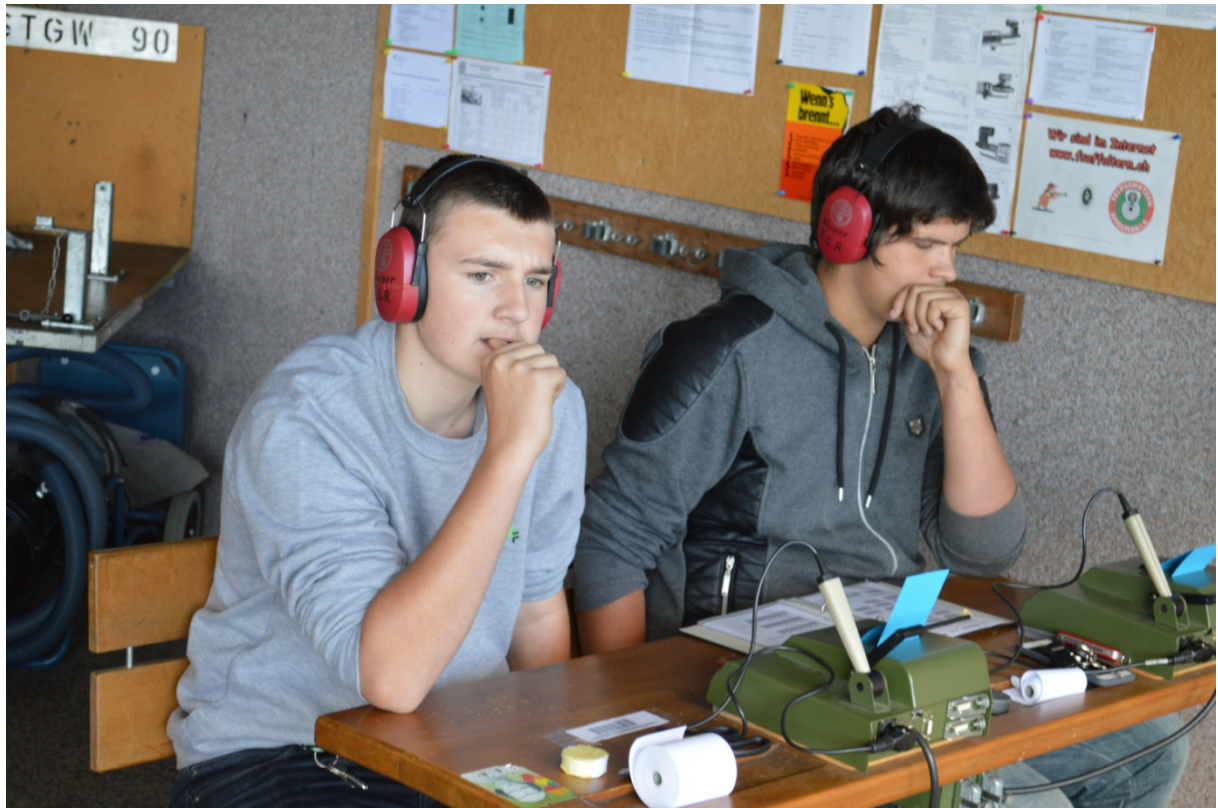
Nun hiess es höchste Konzentration im Schützenhaus und beste Vorbereitung auf den Gruppenwettkampf.